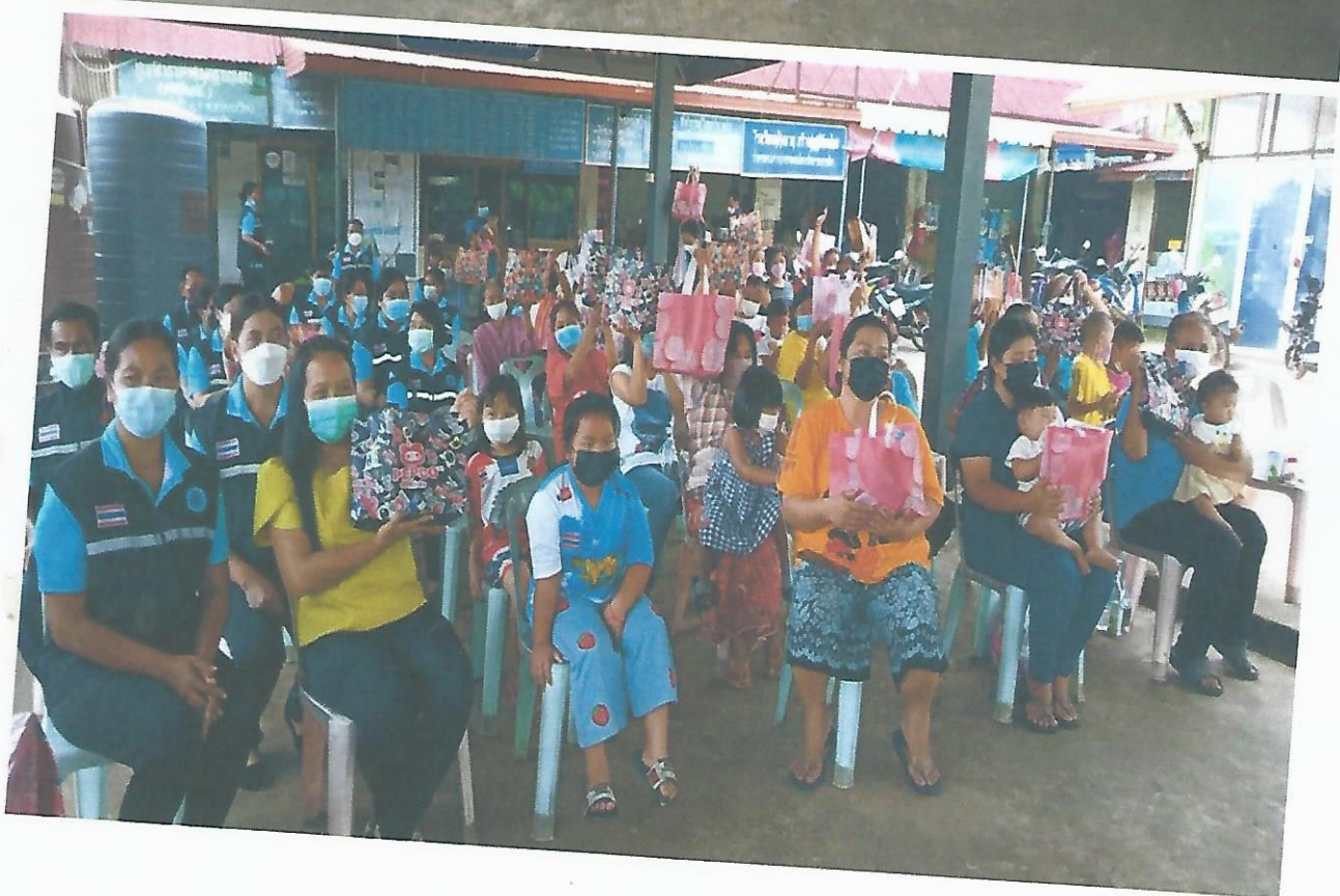
สมาคมโรคผิวหนัง